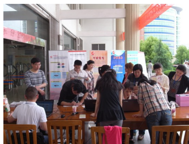
九江学院图书馆活动现场

这次宣传推广活动必将对江西省的 CASHL 文献传递工作起到积极推动作用,通过与同行增加交流,共享经验心得,共同进步提高,也必将对江西省文献传递做出应有的贡献。