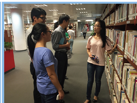
在工作人员的带领下参观国家图书馆