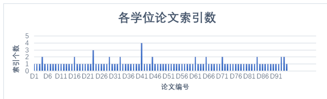
图 2 各学位论文索引数

因存在一篇论文附有多个索引的情况，共获取索引 111 个。大部分学位论文附有索引个数为 1，少量有 2-4 个索引，具体如图 2 所示。其中，最多的一篇是北京大学法学博士论文《基于网络的商业方法专利研究》（作者：刘永沛，导师：郑胜利，2006 年）共有 4 个索引，分别为“美国专利索引”（4 页）、“人名索引”（7 页）、“中英文译名索引”（10 页，实际为术语索引）、“案例索引”（6 页）。