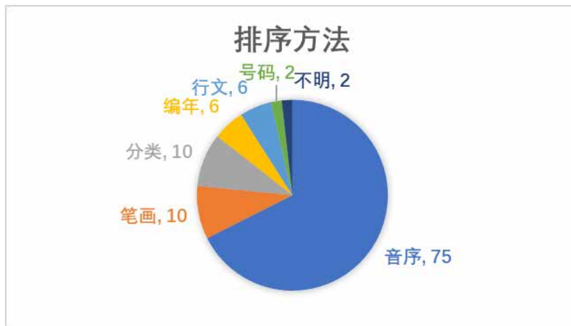
图 6 索引排序方法统计

(4) 排序方法：索引款目的排序往往采用众所周知、通用易懂的方法，包括音序、笔画、编年、分类、四角号码等。就本研究中的 111 个索引而言，具体排序方法分布情况如图 6 所示，音序是最常用的排序方法，111 个索引中有 75 个使用音序排列款目，占三分之二，包括汉语拼音序和英文字母字母序两种；其次是笔画序和分类序，其中分类包括按主题分类、按文献类型划分、按地理区划划分等情况；时间序较多应用于篇目索引中；索引是打破原有文章阐述的顺序，以另一种序化方法来组织款目项，但仍有 6 个索引是按照标目在文中的出现顺序来进行编排，可见编制者对于索引的理解存在一定的偏差；有 2 个索引采用号码顺序，主要是针对专利索引按照专利号编排、针对重要文件按照文件号排序；此外，还有 2 个索引因为缺少说明且序化特征不明显，完全无法识别其排序方法。