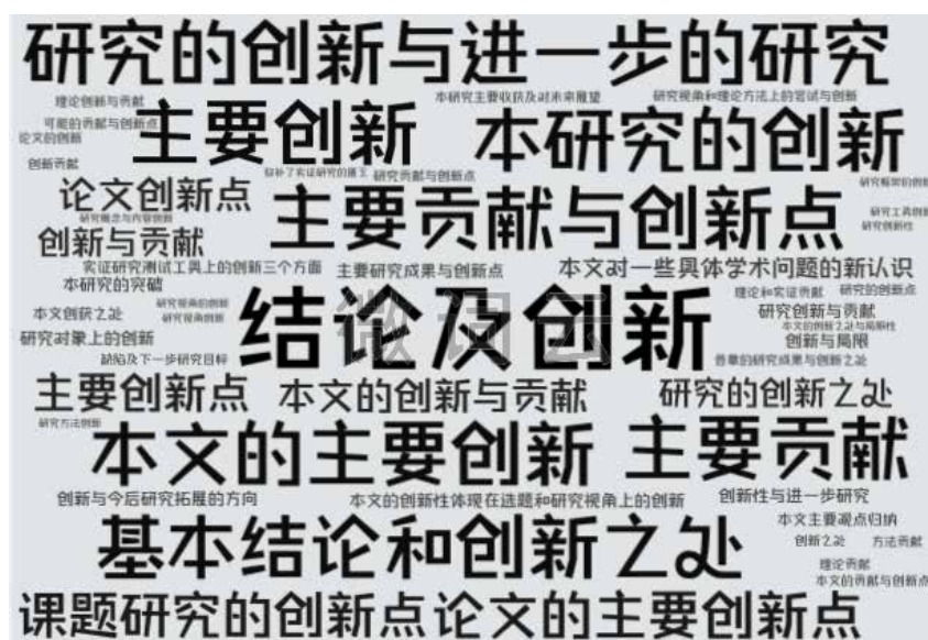
图 9 结论部分创新点的揭示

与绪论一样，规范的学位论文往往也会设置结论、结语、余论这一章节，对整个论文的主要内容、研究结果、创新之处、存在的问题、后续工作等进行总结和展望。通过对这 10 349 篇博士学位论文结论部分的整理，大部分学位论文结论部分不再细分章节，直接在文中以一些句式引导出对创新内容的总结；也有少量论文中会对结论部分进行分节阐述，相应的节标题中也会体现创新内容。具体如图 9 所示。