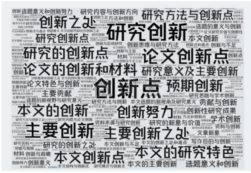
图 8 绪论部分创新点的揭示

学位论文的开头通常会有一章绪论，或称序言、前言、序章等，来交待作者的选题背景和依据、主要研究内容、研究方法、论文章节结构和创新点等。在规范的学位论文中，绪论是不可或缺的一部分。本研究在调研过程中，对绪论部分的章节标题进行整理，发现在大部分绪论中都会单独列出一节指明论文的创新点，在管理类学科中尤其显著。图 8 展示了学位论文绪论中体现论文创新之处的节标题。