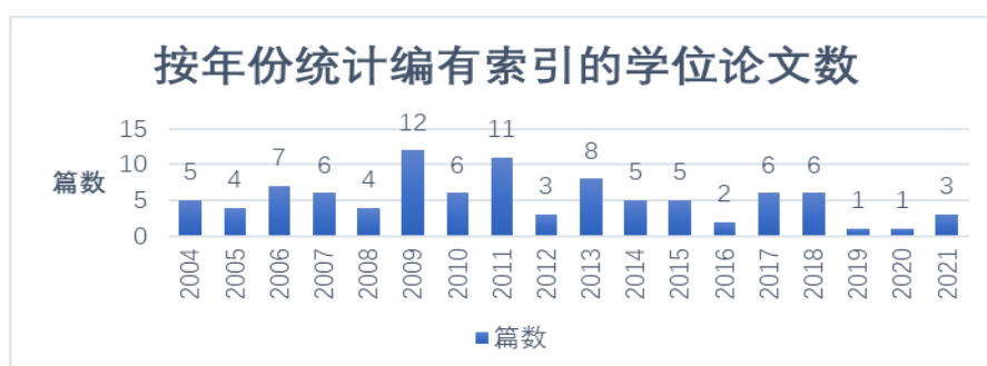
图 1 编有索引的博士学位论文年份分布图

从表 1 的调研数据可知：当前学位论文内容索引整体编制比例极低，10 349 篇学位论文中编有索引的论文仅 95 篇，占比不足 1%，远低于中文专著和教材的索引编制比例。从学科而言，哲学、文学、历史学相对于管理学和法学而言，编制索引的比例略高一些；但就管理学中的图情学科而言，其占比达到了 3.65%，与索引研究归属于图情学科密不可分。